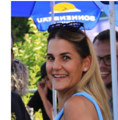
Jacqueline Stiefken Produktion