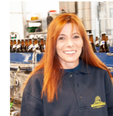
Nicole Nägelein Produktion