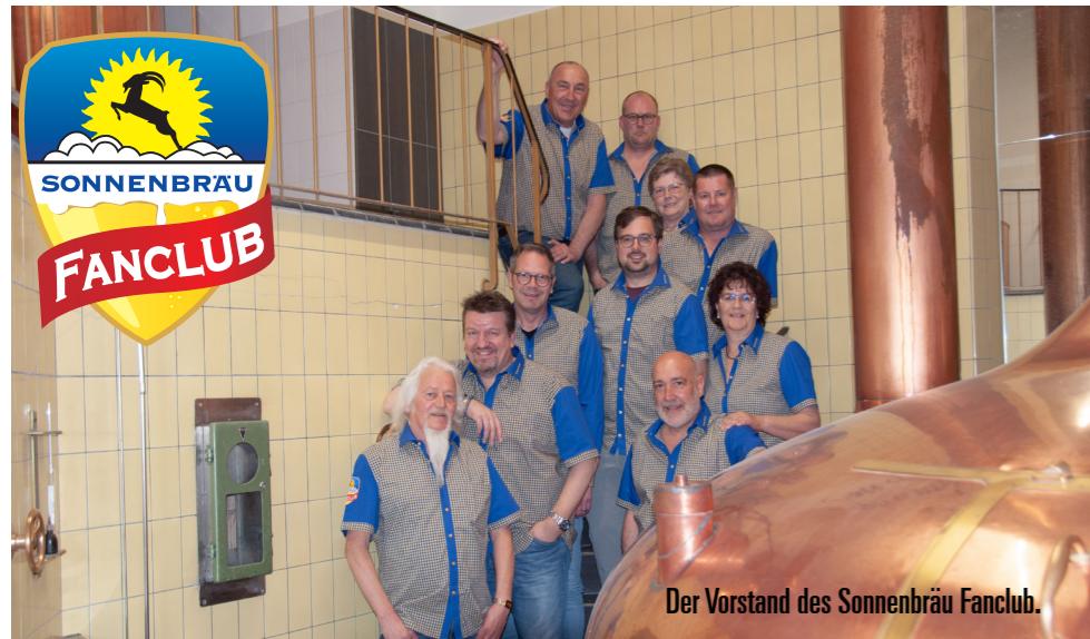
Der Vorstand des Sonnenbräu Fanclub.