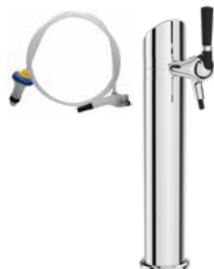
Flexi Draft Zapfsäule