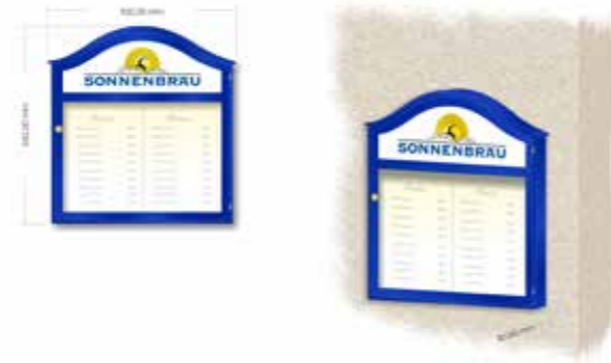
Speisekartenkasten 52 x 52 cm inkl. Beschriftung