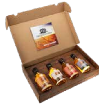
Swisslander 4er Geschenkbox