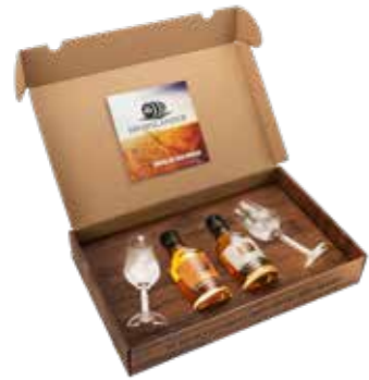
Swisslander 2er Box mit 2 Gläser

Die Sonnenbräu hat auch ein breites Sortiment an Biergeschenken, Werbemitteln und Textilien. Sind Sie auf der Suche nach einem Geschenk? Bei uns sind Sie genau richtig. Profitieren Sie von unserem vielfältigen und umfangreichen Produktsortiment und der kompetenten Beratung. Die abgebildeten Artikel sind erhältlich, solange der Vorrat reicht.