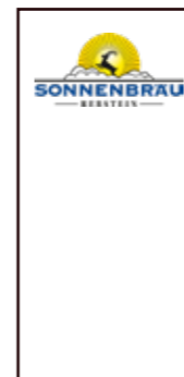
Schreibblock weiss 7.5 x 14 cm - 100 Stück pro Pack