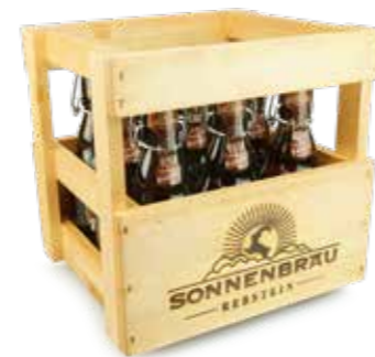
9er Holzharass Büezer