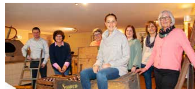
Verkaufnendienst und Administration