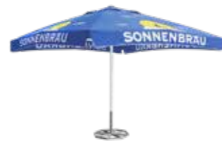
Sonnenschirm gross 3.5 x 3.5 m