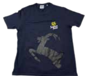
T-Shirt Bock 30