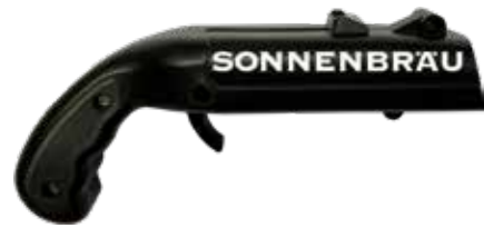
Bottle Cap Gun