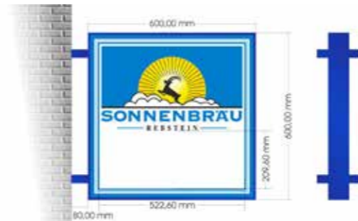
Leuchtkasten quadratisch 80 x 80 cm inkl. Beschriftung