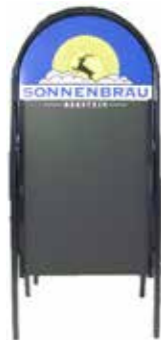
Bocktafel 128 x 58.5 cm inkl. zwei einzelnen Tafeln zum selber beschriften