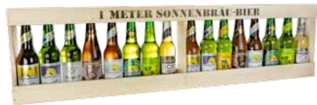
1 Meter Sonnenbräu Bier