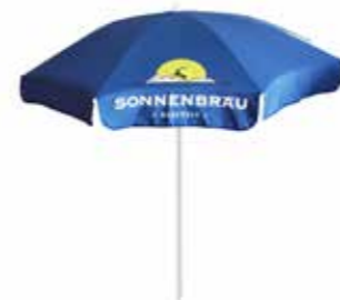
Sonnenschirm klein Durchschnitt 1.8 m