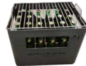
Feuerharass inkl. Rost