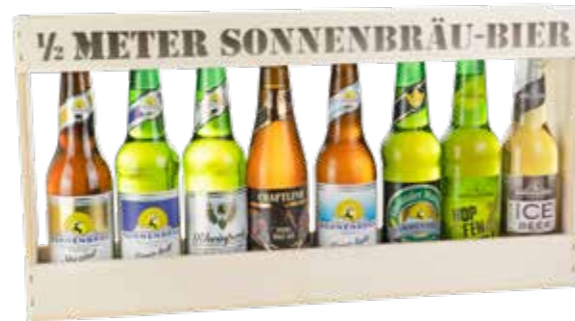
1/2 Meter Sonnenbräu Bier